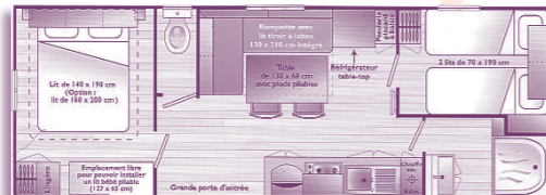
Mobil-home 4/6 pers. 24,90m 2