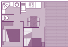
Chalet "Eden" 25m 2 + terrasse couverte