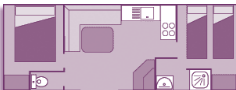
Mobil-home 4/6 pers. 23,40m 2